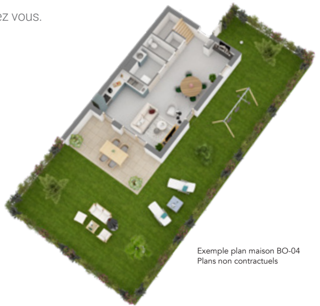
Exemple plan maison BO-04 Plans non contractuels